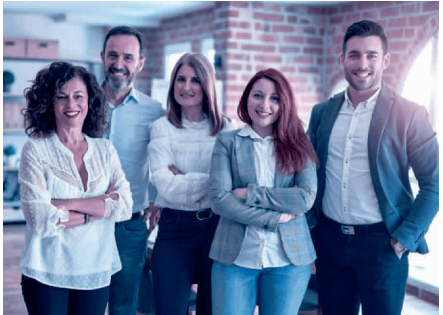
Alles klar: Das Personalreglement schafft eine verbindliche Regelung der Arbeitsbeziehung.

Grundlegender Bestandteil des Personalreglements ist das Arbeitszeitmodell des Unternehmens. Also beispielsweise die gleitende Arbeitszeit mit definierten Blockzeiten, Regelungen zum Homeoffice und die im Betrieb übliche Wochenar-